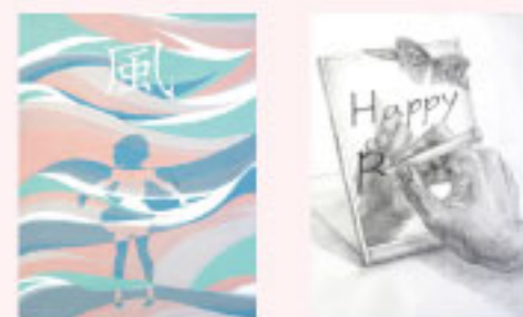
東京造形大学 / デザイン学科 GD 女子美術大学 / デザイン・工芸学科 武蔵野美術大学 / デザイン情報学科 基礎デザイン学科 多摩美術大学 / 情報デザイン学科 新谷デザイン学科 合格 岡山大正寺中等教育学校

現実から目を背け逃げただしたこと、悔しさと不甲斐なさで涙したこと、制作で得られる喜び、達成感、それを取っても画美研でしか体験できなかったものだと今になって思います。1浪時は、仲間にもめぐまれ、様々なイベント、制作、講評、どれも新鮮で楽しい思い出が多かった様に思えます。 1浪時の合格発表で不合格とわかった時もすぐにスタートがされたのは、先生方の強い励ましと、これからの課題を提示してくださったからです。しかし、2浪目のプレッシャーが重く、押し潰され、何もかも無意識に感じ逃げてしまった日々が続きました。今となっては笑い話ですが、実際、衝動的に自転車で60km先まで現実逃避したことがあります。その時も、先生は見放さず真剣に向き合ってくださいました。その時にも、先生はサポートしてくれてくれたので、とても感謝しています。その他にも、書ききれない程の挫折、困難がありました。そのたびに、先生方が導いてくださいました。2浪目で合格通知をいただき最後の受験を終えた際にも、大学生生活についての助言、アドバイス、応援のお言葉をいただきました。この2年間、先生方に支えられ応援していただき、画美研でしかおくれなれない日々が暮らしました。感謝してもしきれません。本当にありがとうございました。