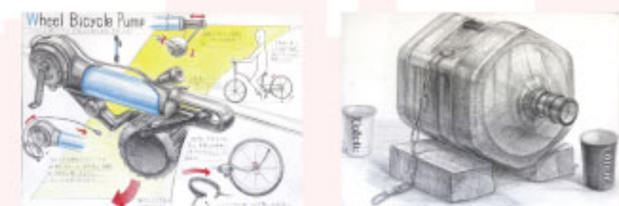
金沢美術工芸大学 / デザイン科 製品デザイン 東京造形大学 / デザイン学科 ID 合格 岡山後楽館高等学校