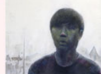
東京造形大学 / 美術学科 絵画 合格 明誠学院高等学校